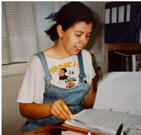
Kudonnanneuvoja työssään 30 vuotta sitten